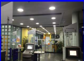
Beleuchtung für Banken