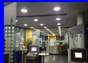
Beleuchtung für Banken